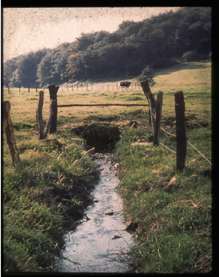
Das Wasser war der größte Feind.

Hier sieht man das Stollenmundloch des Kressieper Erbstollens. Die Stollen sind die Abwasserleitungen eines Bergwerkes. Alle Kohlen oberhalb des Stollens konnten gewonnen werden.