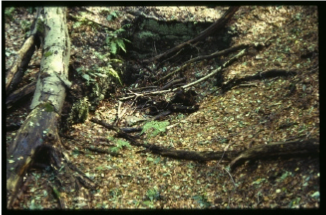
Einsturztrichter (Pinge) des Schachtes Amalie

Daneben die Spur des tieferen Herzkämper Erbstollens. Rechts die alte Bahnlinie, die unten im Tunnel verschwindet.