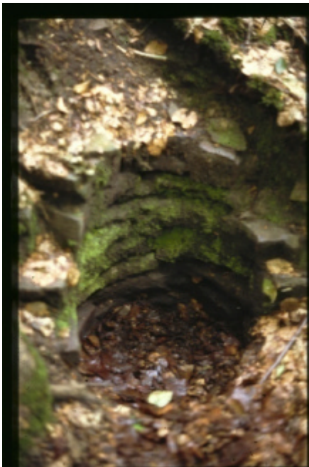
Widerlager des Göpels im Rand der Pinge von Amalie. Da stand vor etwa 200 Jahren die senkrechte Welle drin.