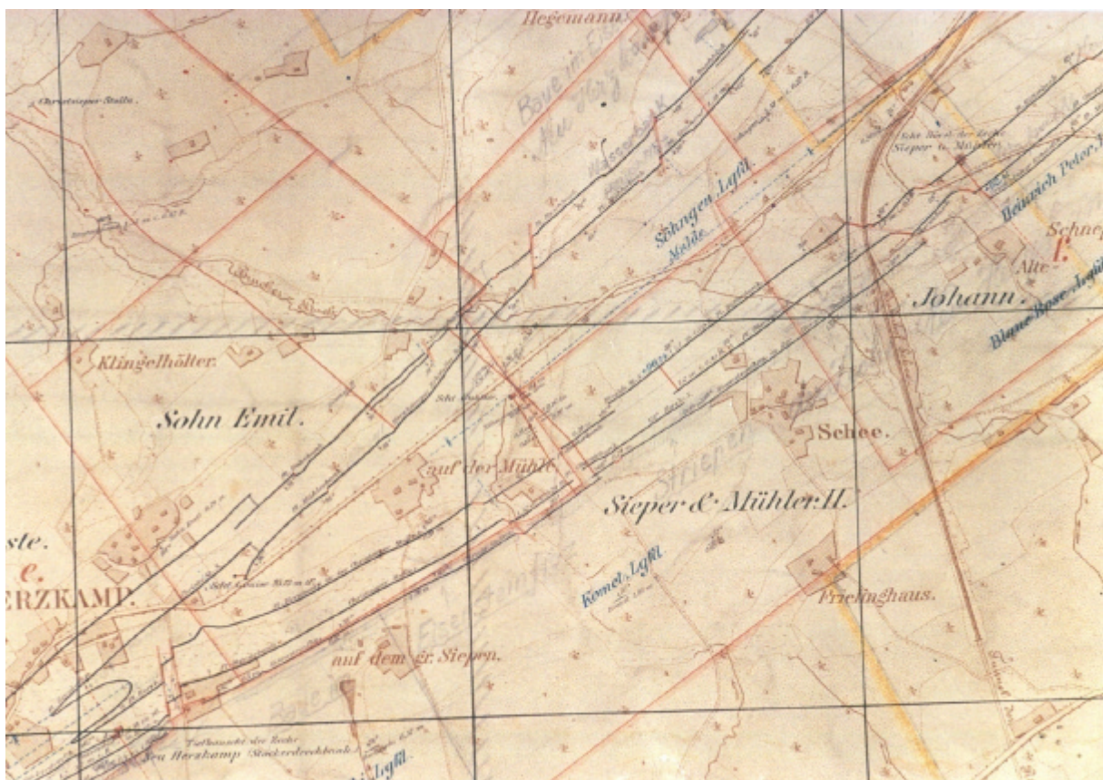
So sieht der Track untertage aus. Die Flözkarte des Wandergebietes. Unten links die Herzkammer Kirche und der Schacht Neu Herzkamp. Oben links das Mundloch des Kressieper Erbstollens.