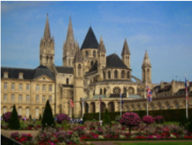
Klosterkirche Saint Etienne

Die nachfolgenden Bilder zeigen eine Anzahl der Sehenswürdigkeiten: