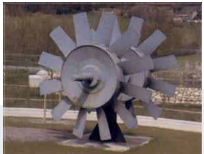
Lüfterrad (Turmag) Text: Ludger Haverkamp, Fotos: HGV

Weitere Informationen finden sich im Internet unter www.hgv-sprockhoevel.de