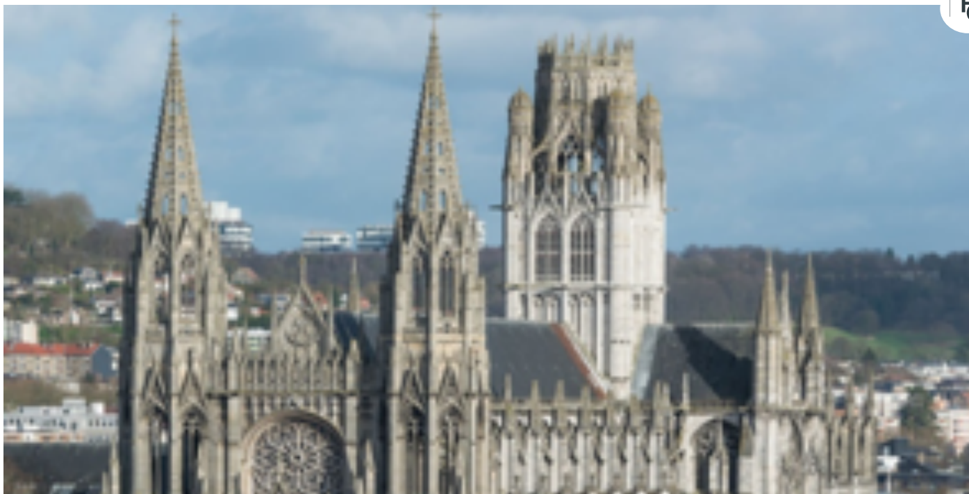
Kathedrale 1235 – 1450

Dank der gotischen Kathedrale und der vielen Kirchtürme erwarb Rouen den Beinamen „Stadt der 100 Kirchtürme“