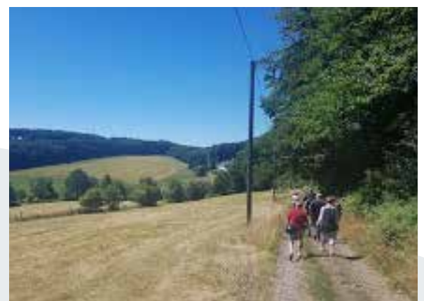
Wandergruppe Montanweg Nord

Und wieder eine Studienfahrt des HGV. Es ging nach Bamberg. Einen ausführlichen Reisebericht finden Sie auf Seite 8.