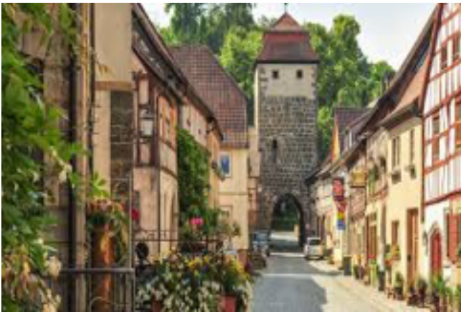
Eingang zur Altstadt