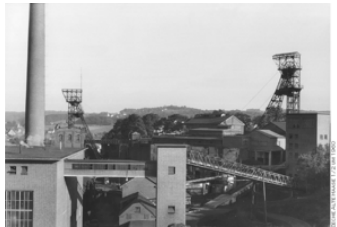
Alte Haase 1969

Die Entwicklung „Alte Haase“ prägte natürlich die heimische, industrielle Entwicklung der Stadt Sprockhövel. Alte Haase selbst erlebte eine Blütezeit. Das wird schon deutlich, wenn man die Bilder vergleicht. Alte Haase beschäftigte im Jahr 1930 - 1288 Belegschaftsmitglieder.