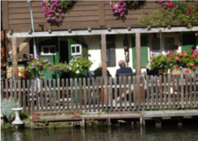
Klein Venedig an der Regnitz

Weltkulturerbe, Klein Venedig, Bamberger Reiter