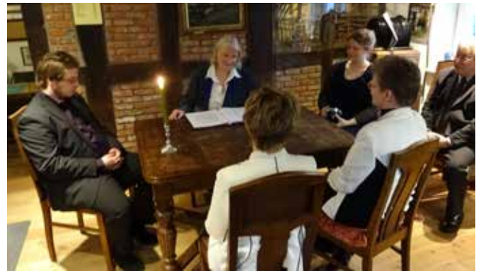
Trauung in der Heimatstube

Eine Tagesexkursion nach Soest mit der schönen Altstadt fand im September statt.