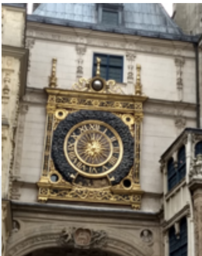
Uhrenturm- 14. Jhd. (Helene Wolters)

Rouen ist eine Hafenstadt an der Seine. Die Stadt wurde im II. Weltkrieg stark zerstört und in den 1950er Jahren neu aufgebaut und ist heute eine moderne Großstadt.