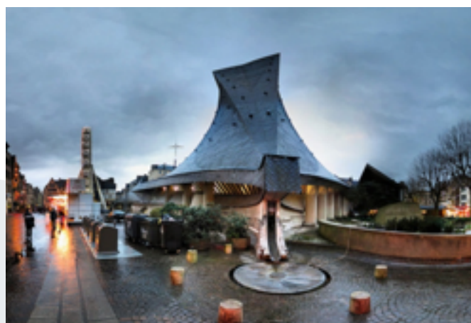
Église Sainte-de-Jeanne-d'Arc - (Panoramas)