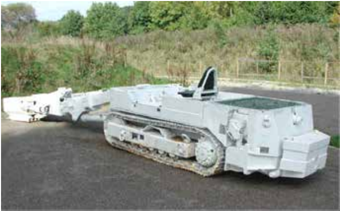
Senklader (Hausherr & Söhne)

Seit Jahren besteht nunmehr der „Park am Malakowturm“. Nach wie vor lohnt sich ein Besuch des Parks, da er wertvolle Informationen bietet. Seine Attraktivität wird der Park demnächst erhöhen, sobald die Zuwegung zum Stolleneingang, der unterhalb der Hattinger Straße zum Malakowturm führt, fertiggestellt ist.