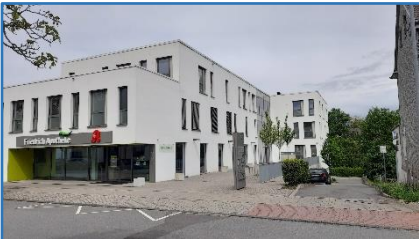
Hattinger Straße 20

mit einer Gartenwirtschaft, rechts neben dem Haus. Waskönig betrieb in den 20er Jahren auch einen Handel mit Schweinen. Hier verkehrten die „Beamten“ der Zeche, bei Börger (Bosselmann) und bei Krieger die Kumpels. Nach dem Tode des Eigentümers Verkauf an Elektro Liebau. Später Abriss und Bau einer Tankstelle mit Waschanlage.