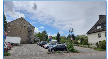
Hattinger Straße 1

Heute sehen wir nur noch Parkplätze sowie die Zu- bzw. Abfahrten zum früheren Feuerwehr-Gerätehaus.