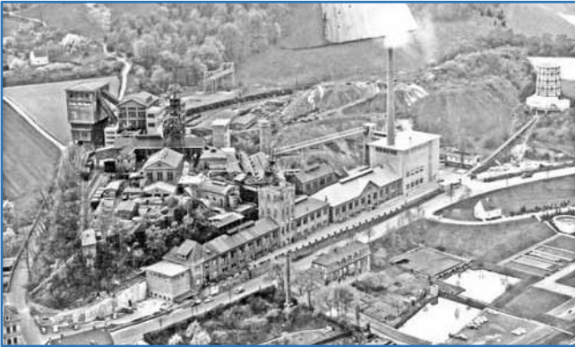
Zeche Alte Haase 1958

Auf dem massigen Malakow-Turm erkennen wir den historischen Schriftzug „ Zeche Alte Haase “, auf dem weißen Schild darunter erfahren wir etwas von der immensen Bedeutung der Anlage für die Stadt Sprockhövel im Laufe der Bergbaugeschichte.