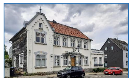
Wuppertaler Straße 22

Der Kegel über dem früheren Gaststätten-Anbau hängt z. Z. an einem Baum im Garten der Heimatstube.