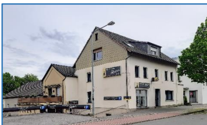
Hattinger Straße 24