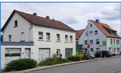
Hattinger Straße 6