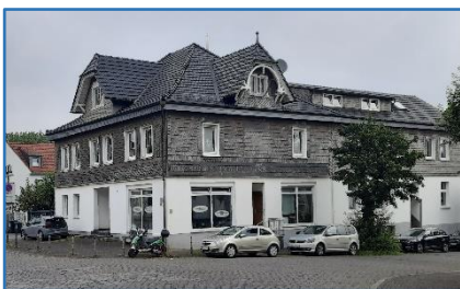
Hattinger Str. 2