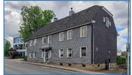
Wuppertaler Straße 8

Aktuell: Gaststätte „Am Wege“ – ein Insidertreff.