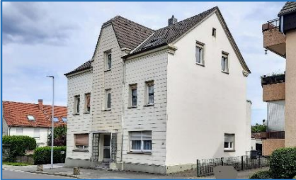
Wuppertaler Straße 55

hier veranstaltete der Knappenverein seine Feste mit Kirmestrubel. Im Saal wurden von 1945 bis ca. Mai 1947 von der Firma Normag Zorge Traktoren gebaut. Die Firma hatte in Hattingen von der Ruhrtaler Nieten- und Schraubenfabrik die ehemalige Schraubenfabrik an der Nierenhofer Straße gekauft.