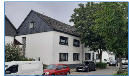
Hattinger Straße 23

Aktuell wird das Haus als Wohnhaus genutzt, nachdem der Anbau ebenfalls zu Wohnzwecken umgebaut worden ist.