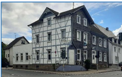
Wuppertaler Straße 15